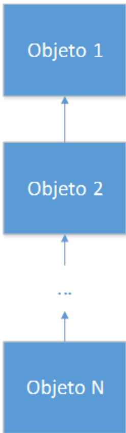
Figura 2. Herança na orientação a objetos

avós, o que faz com que a criança também o faça, e assim sucessivamente. Na orientação a objetos, a questão é exatamente assim, como mostra a Figura 2 . O objeto abaixo na hierarquia irá herdar características de todos os objetos acima dele, seus “ancestrais”. A herança a partir das características do objeto mais acima é considerada herança direta, enquanto as demais são consideradas heranças indiretas. Por exemplo, na família, a criança herda diretamente do pai e indiretamente do avô e do bisavô.