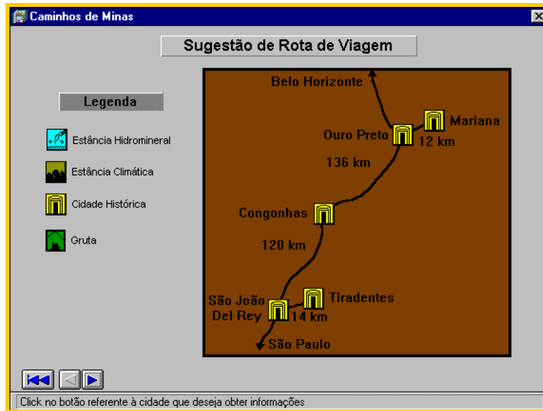
Tela de um título hipermídia